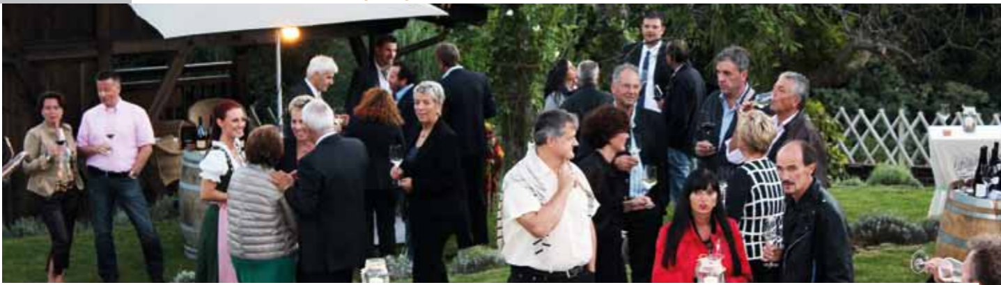
Der Weinpfad – die Gastgeber und Südtiroler Weinproduzenten führten die Gäste auf einem Weinpfad durch den Garten.