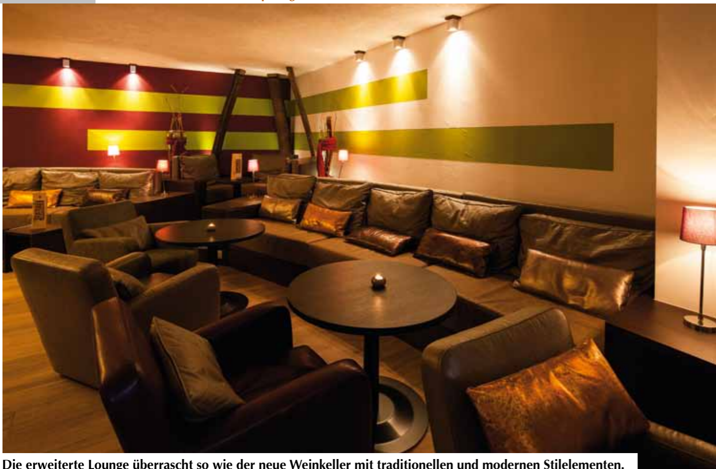
Die erweiterte Lounge überrascht so wie der neue Weinkeller mit traditionellen und modernen Stilelementen.