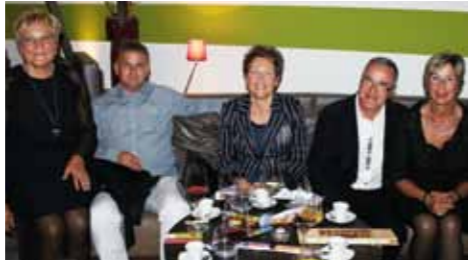
Gemütlicher Fest-Abschluss in der neuen Lounge mit Espresso und Tiroler Edel von der Konditorei Haag in Landeck.